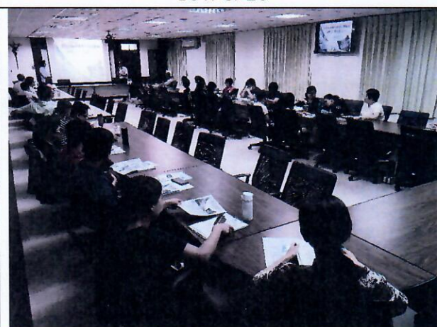
中山大學 吳季昭老師 學校本位國際教育之推廣與演練 107/8/27